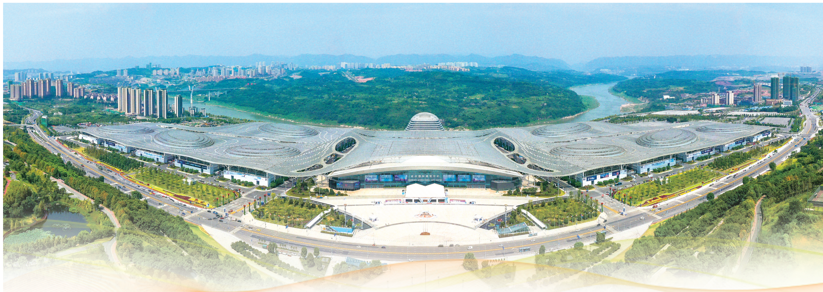
重庆国际博览中心全景图