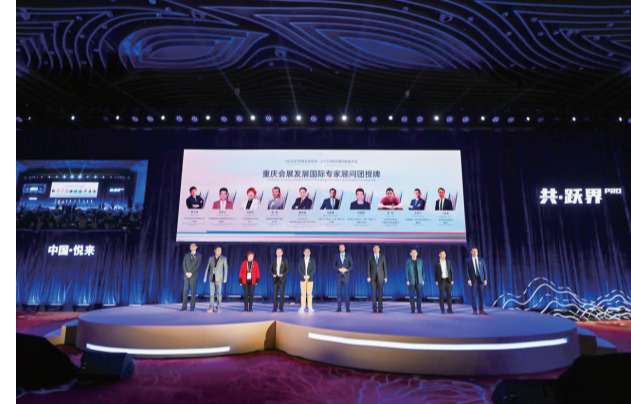
重庆国博中心向全球会展业发出“重庆会展声音”

2013年,展览营销部首次接触中国教育装备展示会主办方,开启了一场长达6年的“申办马拉松”。面对一线城市的资源碾压,她们以“敢作敢为”的魄力,推动展会于2019年落户重庆国博中心。首展即创下展位破万、面积达18万平方米的纪录,吸引1450家企业参展,观众超20万人次。此后,该展会连续三届选择重庆,2024年规模更突破20万平方米,成为中国教育装备展示会历年来展位数量最多、参展企业最多、展示产品覆盖面最广、到场观众最多的一届。