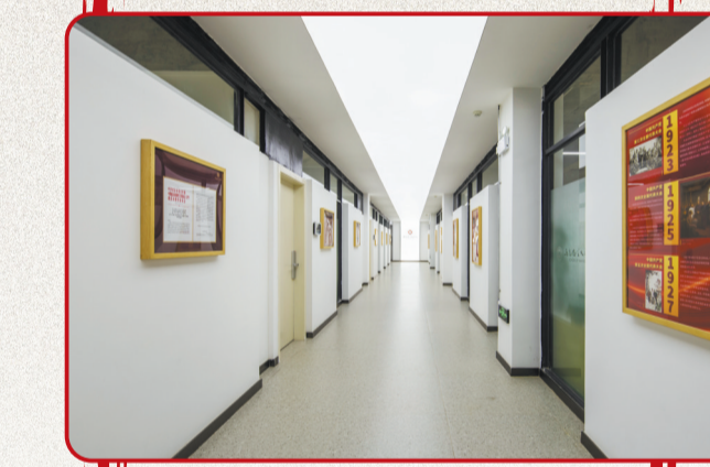
四川美术学院马克思主义学院