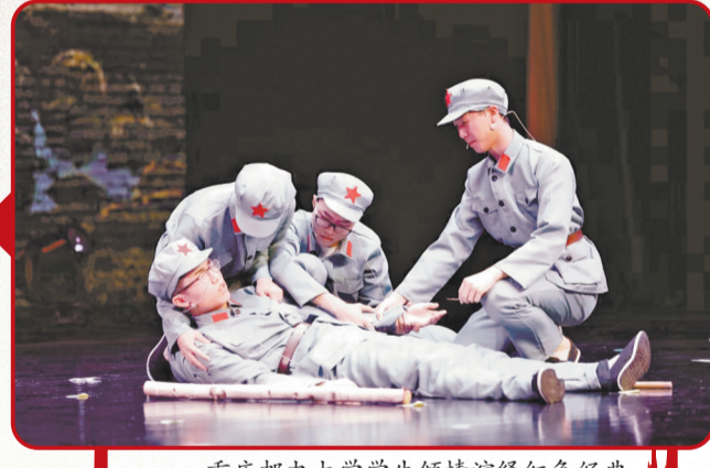
重庆邮电大学学生倾情演绎红色经典