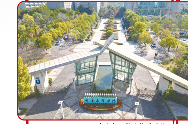
重庆文理学院校园风貌