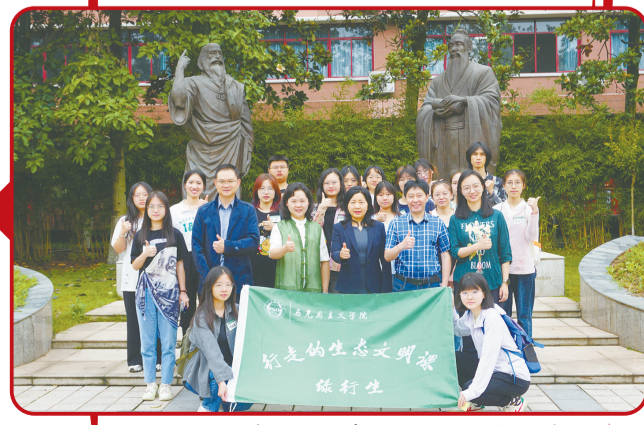
四川外国语大学马院师生开展“行走的生态文明·绿行生”活动

推进大中小学思想政治教育一体化建设是全面落实立德树人根本任务的客观需要，是推动思想政治教育高质量发展的内在要求，是加快教育现代化、建设教育强国的重要举措。