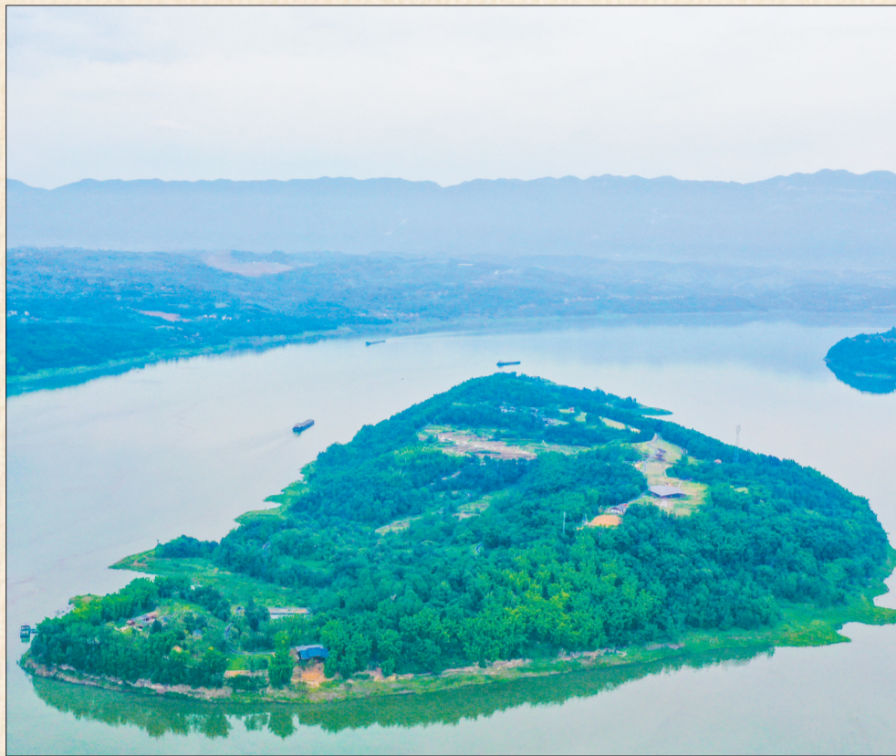
重庆忠县的长江江心岛皇华岛一带景象。

研讨会开幕式上还举行了川渝宋元山城遗址保护利用联盟成立仪式,宣读了联盟倡议书,川渝宋元山城老鼓楼衙署遗址、云顶城、神臂城、钓鱼城、苦竹隘、白帝城、大获城、