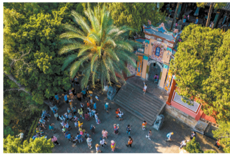
重庆市奉节县白帝城景区。