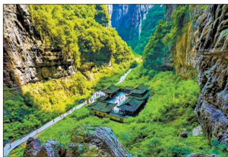
武隆天坑地缝。

未来,安心游还将持续迭代升级,不断丰富完善系统功能,聚集优质供给,坚持数字赋能,提升群众满意度。