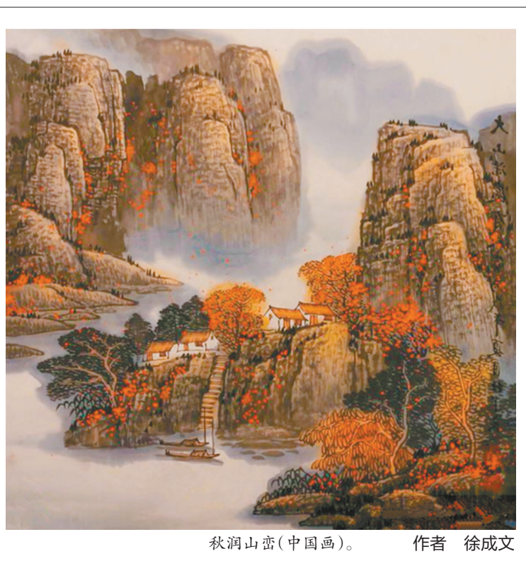
秋润山峦(中国画)。 作者 徐成文