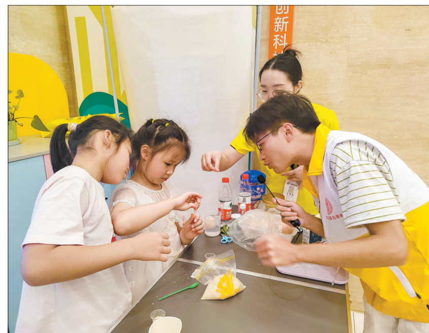
大学生志愿者指导小朋友检测大米新鲜度。

该课程获得在场小朋友和家长的热烈反响。“没想到生活中还有这么多需要注意的食品安全问题!”“我学会了自己分辨食品的安全性了,以后一定不吃‘三无产品’、变质食品和过期食品!”本次科学课以实验为主,参与性、互动性较强,让小朋友们能够近距离感受科学、参与科学、亲近科学,在帮助提升食品安全意识的同时进一步激发青少年对科学知识的兴趣。(大足区科协供稿)