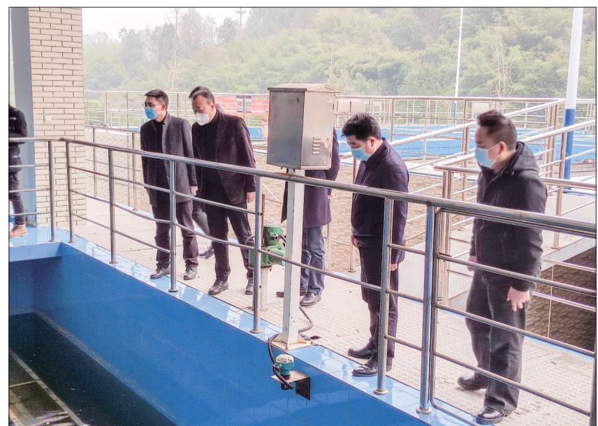
重庆渝江水务有限公司有关领导到水厂检查工作。

举措一：强规划、谋发展。 加快推进一品水厂改造工程进度，真正实现南湖水厂与一品水厂和龙岗水厂供水管网互联互通，最大限度发挥各水厂的供水能力和应急功能，为全区经济社会发