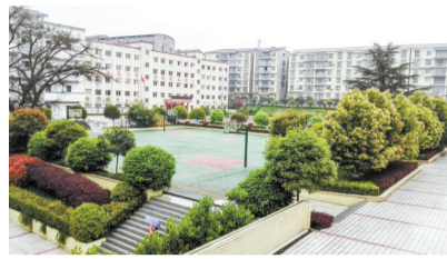
花园式学校。 (垫江县砚台小学校供图)

学校坚持把培养全面发展的学生作为创建绿色学校的重要支柱,通过各种活动夯实德育工作,学校积极开展丰富多彩的节日庆典活动,通过仪式教育,让这些平凡的日子在学生的心中留下了难忘的童年回忆。每年“六一”、元旦,学校会以丰富多彩的活动欢庆节日,从跳蚤市场到游园会,从“春之声”合唱比赛到课本剧表演,变化的是活动的形式,不变的是学生积极展示的勇气。除了常规节日,学校还开展具有特色的“读书节”“运动节”“环保节”“英语节”等,从各个方面给学生提供了展示才华的舞台。学校篮球队、足球队常年训练,效果显著。