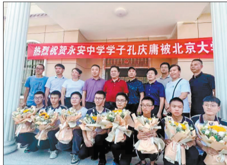
优秀学生与学校领导及教师合影。

关心教师，就是关心学校。学校坚持“以人为本”的管理理念，研究制定奉节永安中学专项制度和一系列常规管理制度，推动学校规范发展。