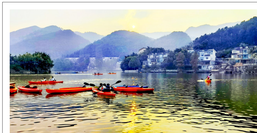
荷兰云天。

母亲说, 用开水调鸡蛋, 不仅节省火力, 而且蒸出来的蛋味道更鲜嫩。陆游有首名诗《冬夜读书示子聿》, 诗中云: 绝知此事要躬行。母亲的蒸鸡蛋, 确是让我深深地触摸到了“纸上得来终觉浅”的道理。