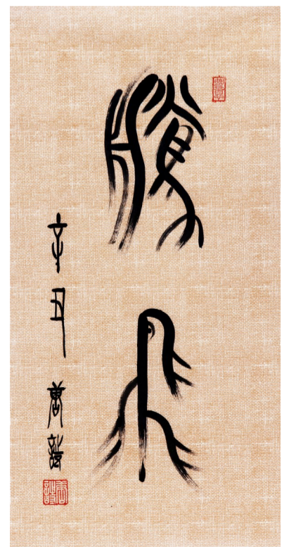
腾飞(篆书)。 作者 唐诗