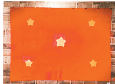
罗广斌在白公馆监狱中和狱友一同制作的红旗。 重庆红岩革命历史博物馆 藏