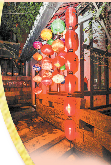
▲喜迎新春。 科技工作者 吴玥瞳 摄