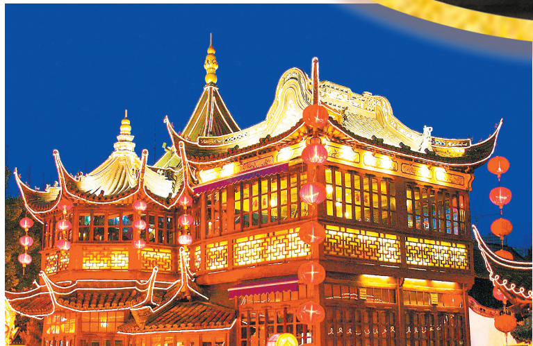
▼张灯结彩。