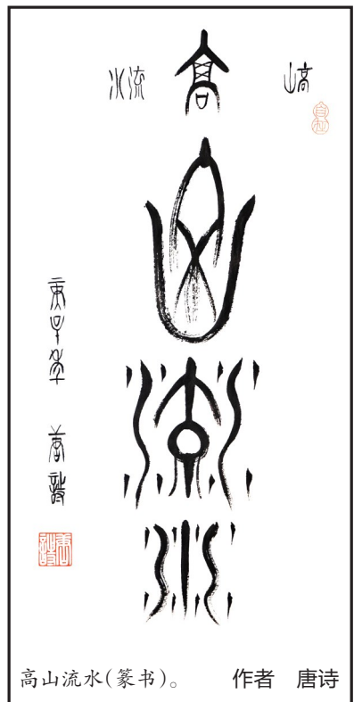
高山流水(篆书)。 作者 唐诗

踏足沾染什么,而它的原住民企鹅却有权在冬季横尸遍野、在整个夏季发出恶臭。这或许正是让人失落的一点。无论住上几年,没有人把这里当成“家”,我们不是它的子民,我们不敢任性在这里生死。所有的人终究要回去,拥抱曾经的熟稔和不屑,释放让人发笑的激情与爱。