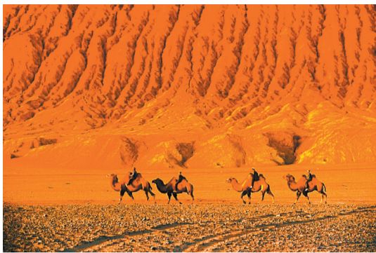
▲驼队归途。