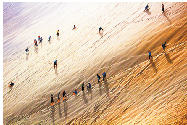
▲旅人攀登。