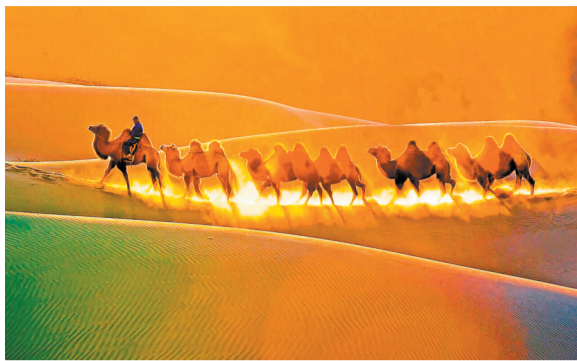
▲行走沙洲。