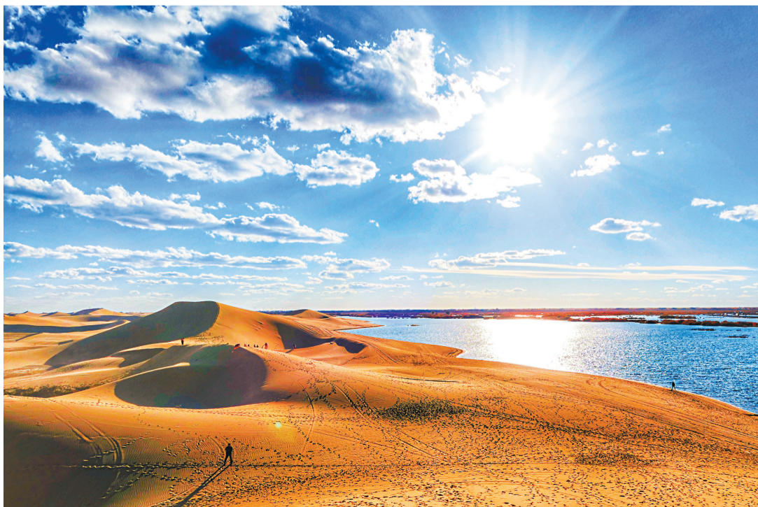
▲沙洲艳阳。

在浩瀚的沙漠中,偶尔看见了那蓝色的、亮亮的湖泊。它是沙漠中的绿洲,它是沙漠的宝贝,它是沙海的珍珠。