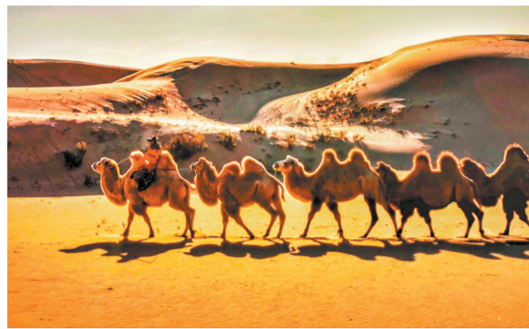
▲大漠驼铃。