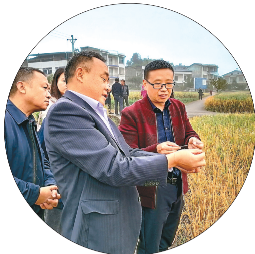
市农科院水稻研究团队在科研现场。