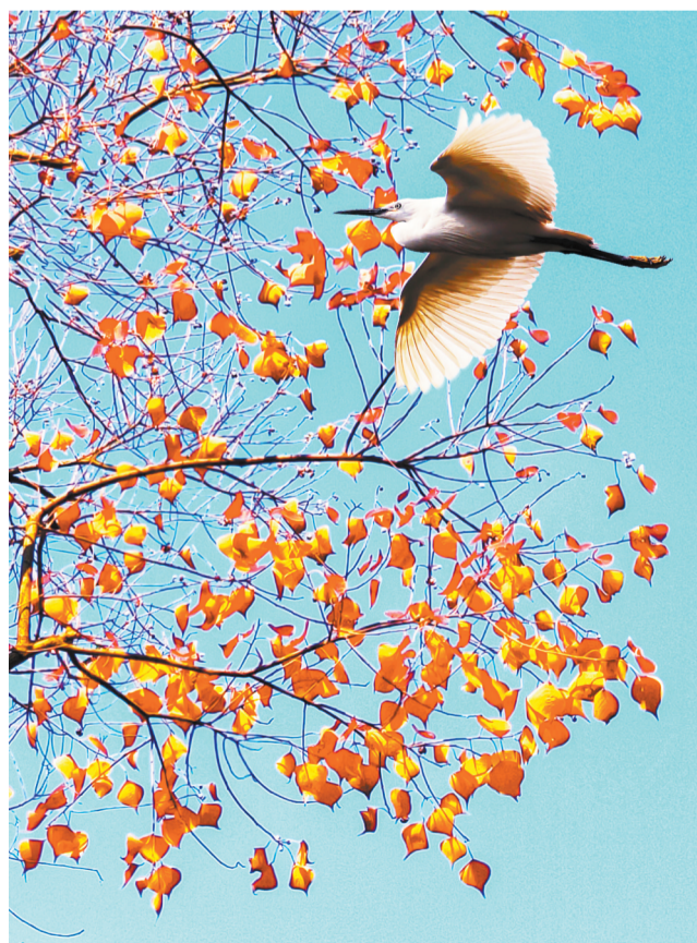
►展翅高飞。