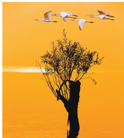
▲沐浴晚霞。

它们一会儿翻飞在暮色深沉的河面，回旋着，扑棱着美丽的双翅，一会儿又站立在河中央漂动的水草上，用它那铁色的长喙啄食着水草上的小虫。偶尔，它也会仰起头，看看即将沉落的残阳，还有浩浩荡荡东流的河水，那神态总是那么优雅。就这样循环往复地飞来飞去，仿佛在和自己玩着寂寞的游戏。