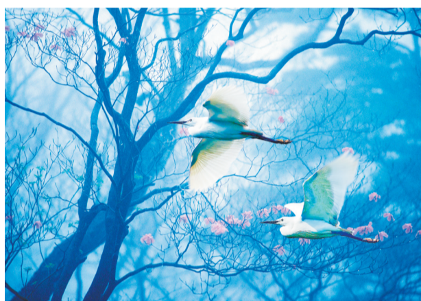
▲绿野仙踪。