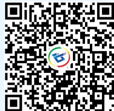
天府科技云APP二维码

撑、以创新为动力的更高质量、更高效益的发展;通过广泛、智能、精准共享全省乃至全国科普资源,对广大人民群众进行与其生产生活密切相关的个性化的直达科普、精准科普、智慧科普,全面提升群众科学素质。以此建立起以市场机制为根本办法、以互利共赢为根本驱动力、以现代信息技术为根本保障的精准科技服务模式。深入推进“天府科技云”服务,能切实有效精准发挥科技人才第一资源作用,切实有效精准发挥科学技术“第一生产力”作用。