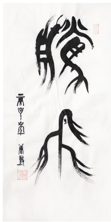
腾飞(篆书)。作者 唐诗

毫无疑问,普罗明的基因遗传学理论,有许多地方颠覆了我们的想象。对此,普罗明表现得极为坦率,他说:“我也很紧张,我知道我的研究已经改变了心理学,会改变临床心理学,正在改变生命科学的各种领域,最终可能会影响整个社会。但是,我觉得我们已经到了改变的节点,我只能屏住呼吸,看看将来会朝什么方向改变。”真理只会越辩越明,这样的表态,无疑已彰显出他足够的理性和科学态度。