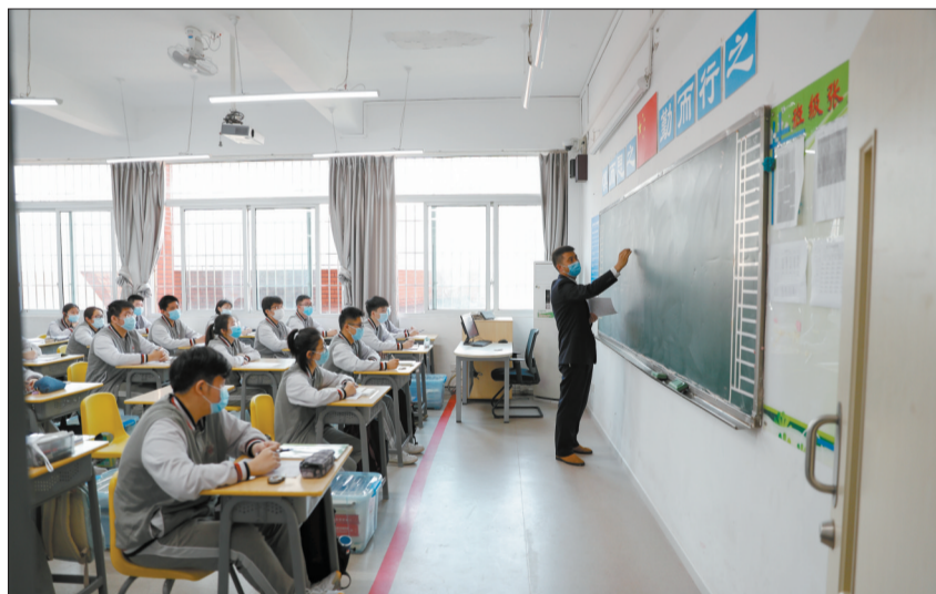
4月27日,在重庆市为明学校,高二、初高中非毕业年级学生正式开学复课。当日,重庆市各小学四至六年

疫情在英国暴发后,王佳接到不少家长和学生关于今年秋季入学的咨询。“不少学生和家对2020年秋季入学还是有疑虑的,在此背景下,建议在考虑健康安全的基础上,尽量按照原计划入读已拿到录取通知的高校或计划入读的专业和课程。如果希望延期一年入学,也可以申请录取延期。”王佳说。