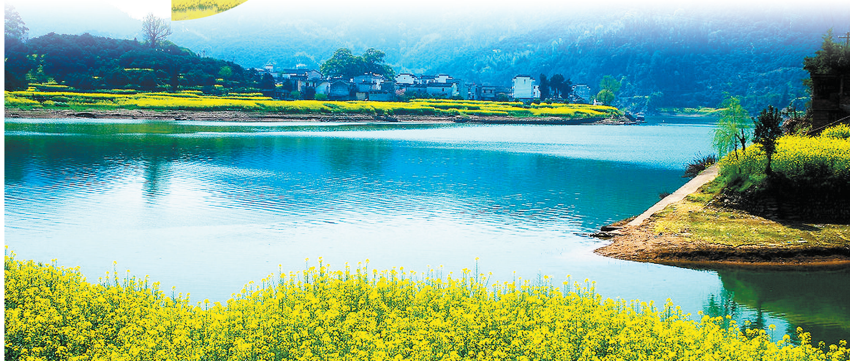
▲乡间春色流水香。 基层科技工作者 王必旭 摄