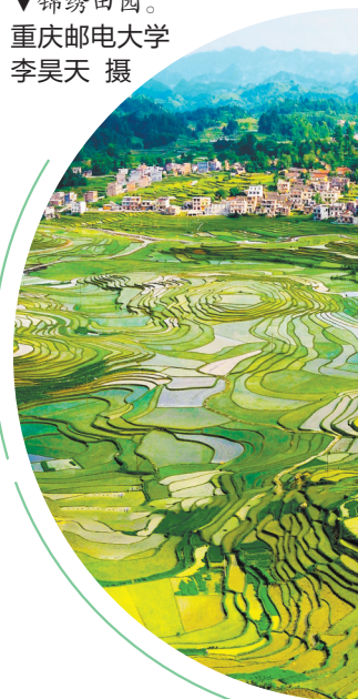
▼锦绣田园。