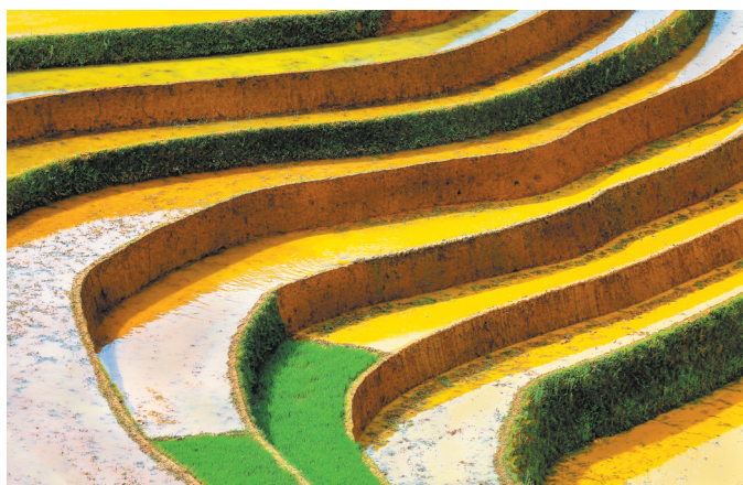
►春的符号。