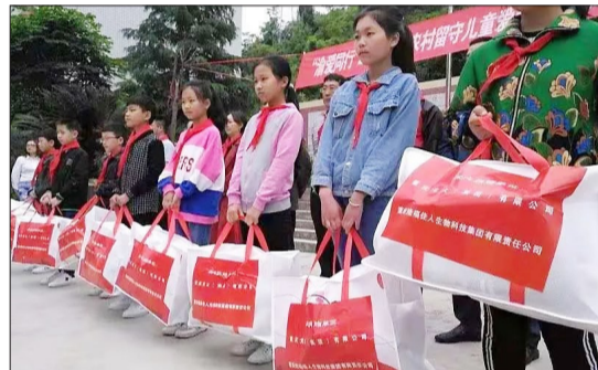
公司为贫困山区儿童捐赠礼物。

不仅在植物王国的云南丽江、香格里拉投资1.2亿元建立了数千亩种植基地,还依托资金、原材料的优势与云南省数家生物研究所合作建立了多个国家生物科技实验室,形成了以种植、研发、生产、销售为一体的绿色天然产业化大型科技企业,不断开拓国内外销售市场。利用先进的质量检测设备和科学的管理理念,形成了完整的质量监督体系,生产工厂配有空气净化除尘系统、自动温度调节、自动无菌检测等工具,拥有高标准实验室、检测室。并已通过国家GMP认证、HACCP认证、ISO9001认证,其生产工艺、流程和质量保证完全达到国家营养食品卫生安全标准。