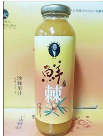
公司研发生产的沙棘汁。

不仅在植物王国的云南丽江、香格里拉投资1.2亿元建立了数千亩种植基地,还依托资金、原材料的优势与云南省数家生物研究所合作建立了多个国家生物科技实验室,形成了以种植、研发、生产、销售为一体的绿色天然产业化大型科技企业,不断开拓国内外销售市场。利用先进的质量检测设备和科学的管理理念,形成了完整的质量监督体系,生产工厂配有空气净化除尘系统、自动温度调节、自动无菌检测等工具,拥有高标准实验室、检测室。并已通过国家GMP认证、HACCP认证、ISO9001认证,其生产工艺、流程和质量保证完全达到国家营养食品卫生安全标准。