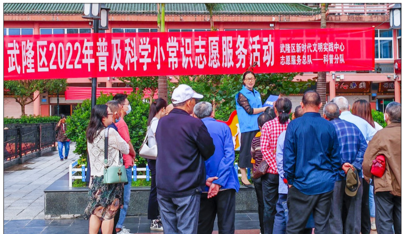
5月24日,武隆区科协开展“普及科学小常识”志愿服务活动,科普志愿者以“知识宣讲+资料发送”的