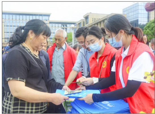
►5月24日,2022年梁平区科技活动周启动仪式暨主场宣传展览活动举行,科技志愿者发放宣传资料800余份,接受现场咨询300余人次。

获得“优秀科技工作者”称号的代表表示,衷心感谢党和国家对科技工作者的关心关爱,这份荣誉既是巨大的精神鼓舞,又是砥砺奋进的鞭策。要结合工作实际,聚焦科技创新研究、科技人才储备、产业融合发展等主题发挥作用,为璧山科技创新发展做出新的更大的贡献。