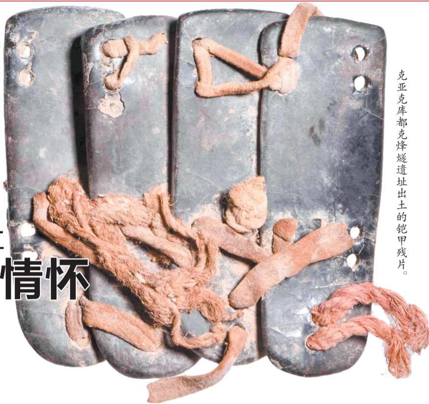
克亚克库都克烽燧遗址出土的铠甲残片。