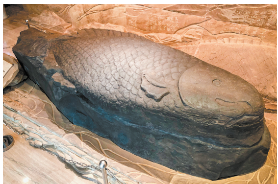
▲高浮雕石鱼。