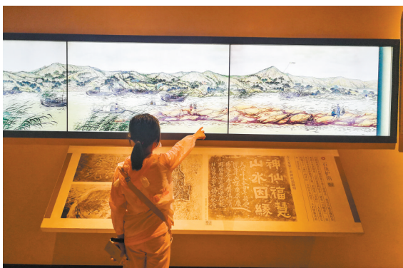
▲小朋友正在参观石梁出水动画。