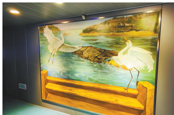
▲白鹤时鸣。