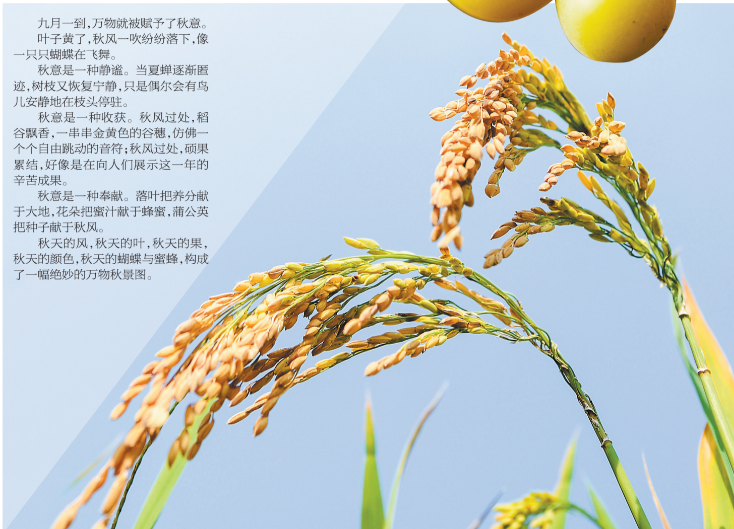
▲丰收在望。安徽科技大学 李陶 摄

秋天的风,秋天的叶,秋天的果,秋天的颜色,秋天的蝴蝶与蜜蜂,构成了一幅绝妙的万物秋景图。