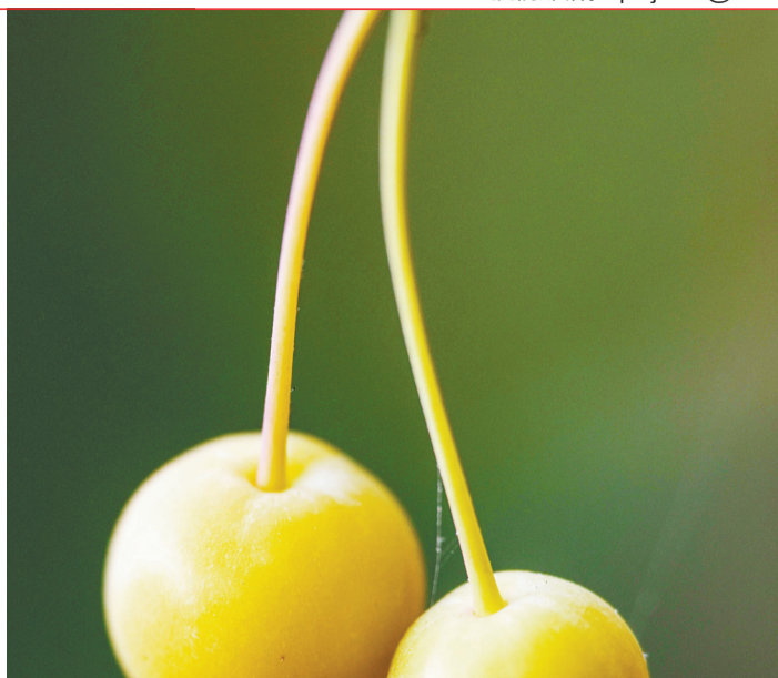
▲秋果。四川外国语大学 张小雨 摄