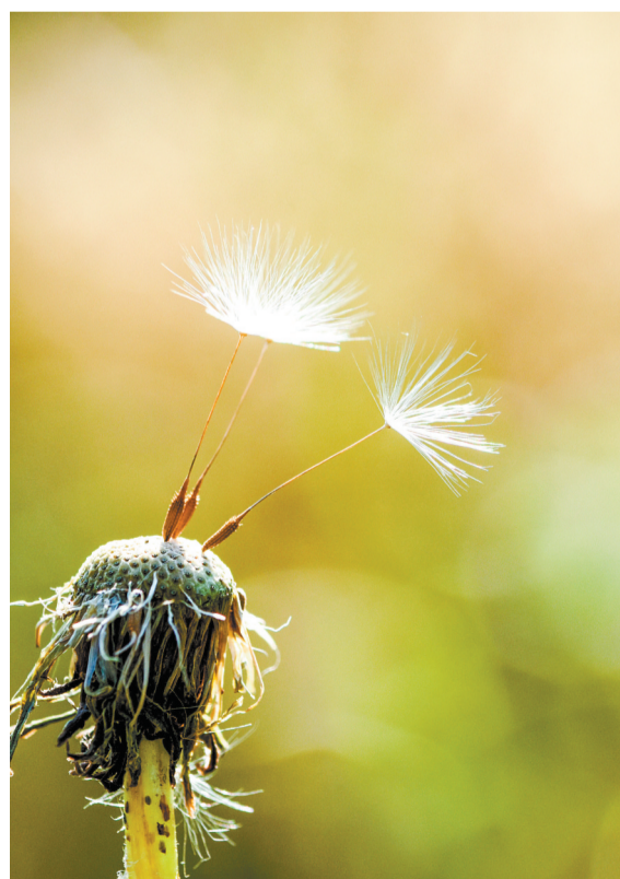
▲秋影。重庆长安汽车股份有限公司 翁伟 摄