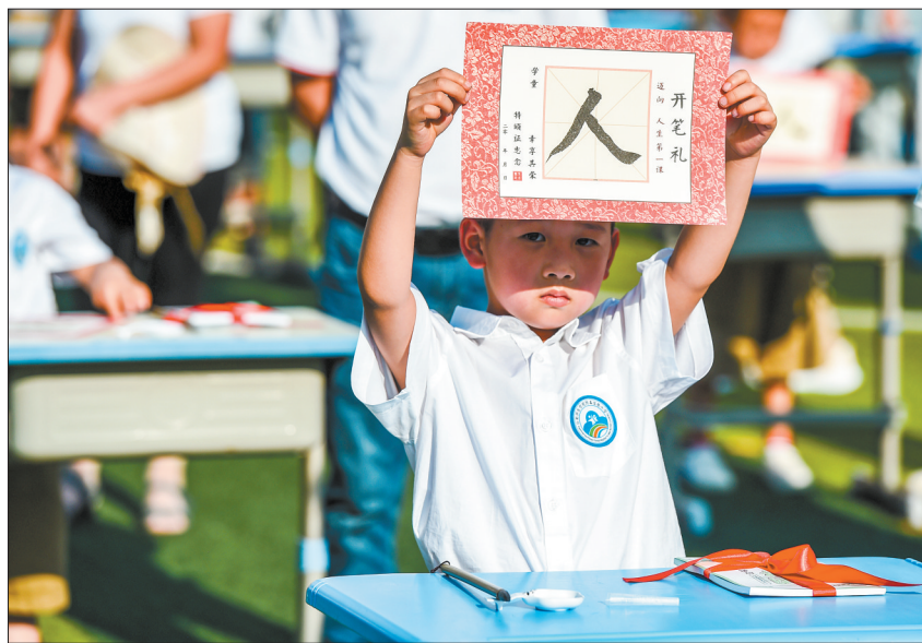
8月31日,在合肥师范学院附属实验小学,一年级新生展示自己在“开笔礼”仪式上用毛笔写的“人”字。

各地各校要通过家长会、家长委员会和《给家长的一封信》等多种方式,密切与家长的沟通交流,主动争取家长理解、支持学校做好“双减”有关工作,形成家校协同育人、协同减负的工作合力。(本报综合)