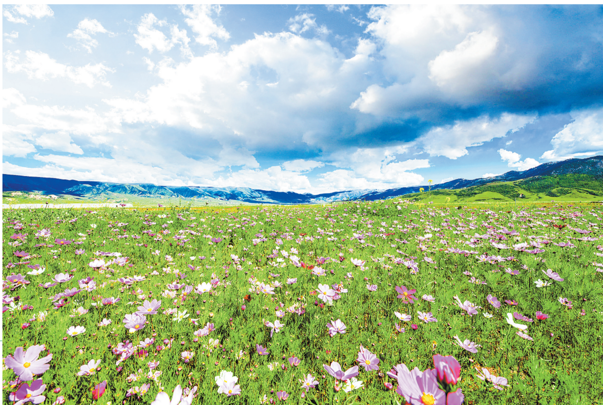
►格桑花海。