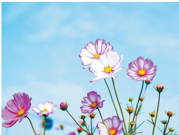
▲美好之花。