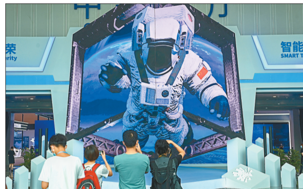
8月23日,重庆国际博览中心智博会现场,中央大厅入口处的裸眼3D,吸引了市民拍照留影。