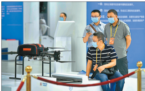
8月23日,重庆国际博览中心,中国—上合组织数字经济合作展馆智慧物流装备及应用展区的工业无人机。