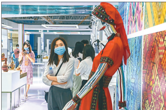
8月23日,重庆国际博览中心,中国—上合组织数字经济合作展馆塔吉克斯坦共和国展厅展出的精致服装。