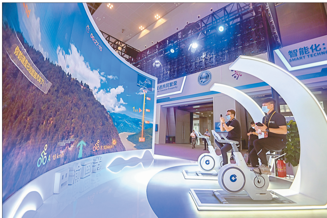
▲8月23日,重庆国际博览中心智博会现场,市民正在骑行单车,漫游“巴渝画卷”。

馆。展馆现场展出了哪些吸睛的智能技术及应用?它们将给我们的生产生活带来怎样的变化?记者通过镜头,一一为您呈现。