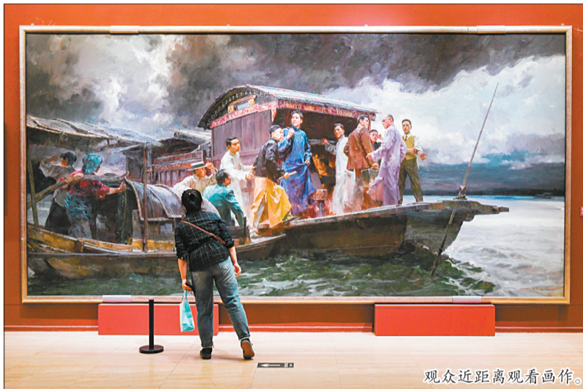
观众近距离观看画作。