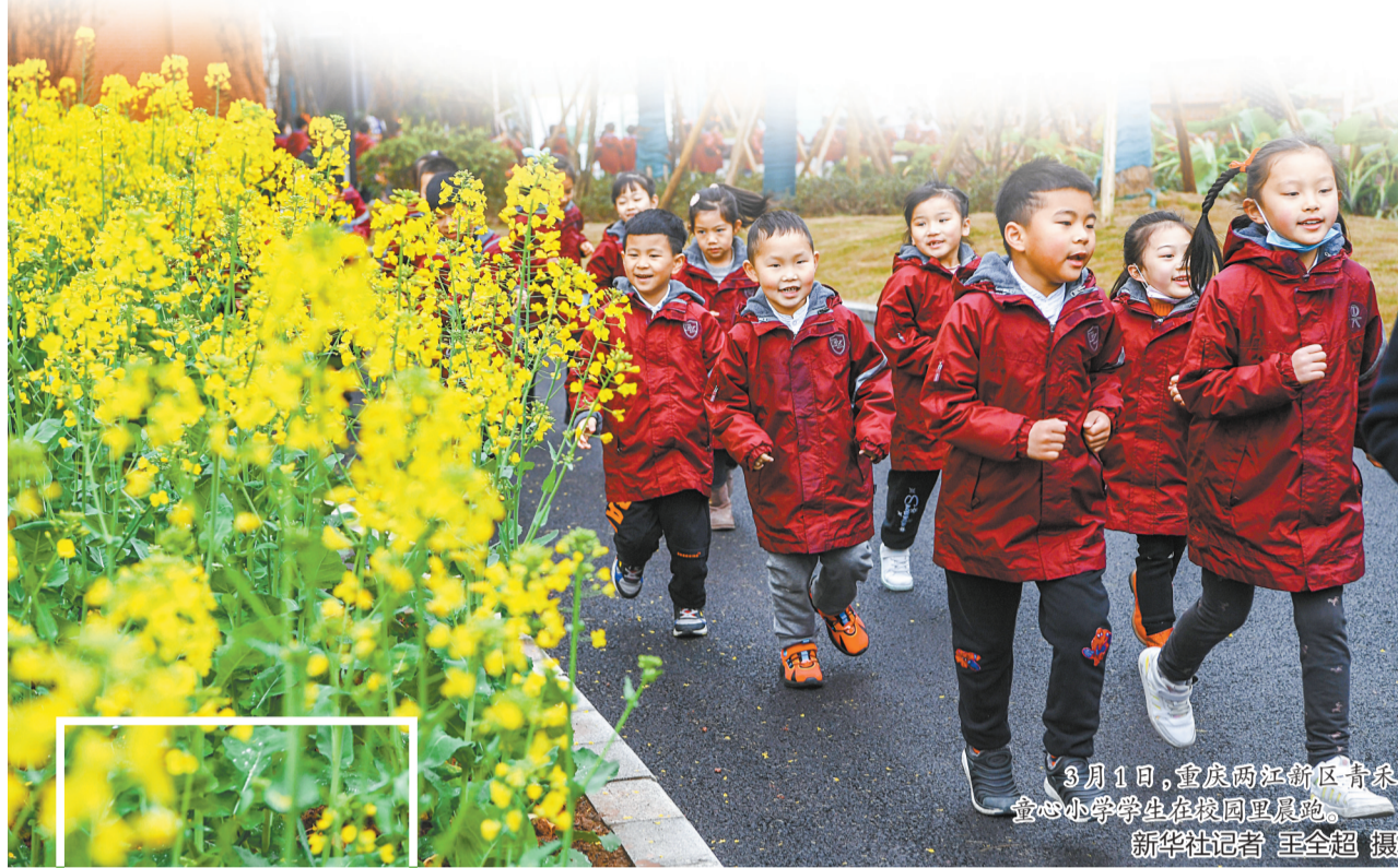
3月1日,重庆两江新区青杠 童心小学学生在校园里晨跑。

春天已至,万象更新。 在3月的第一天,全国 多地的中小学生迎来崭新 的学期。开学前夕,记者 在各地校园里,看见师生 们返校井然有序、热情满 怀。新的一年,大家都铆 足了“干劲”!