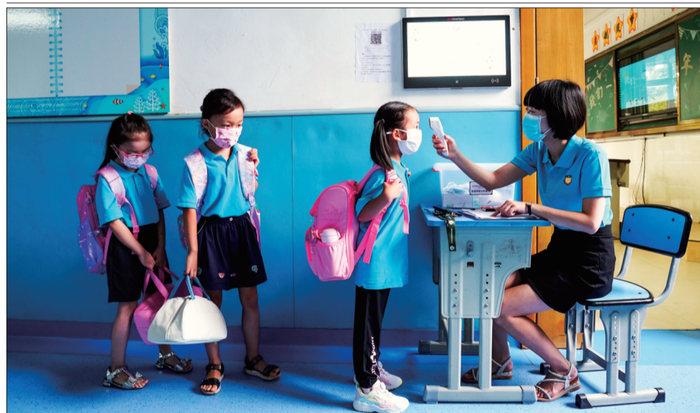
近日,重庆市两江新区金渝学校一年级学生在教室门口有序接受二次体温测量,全面做好疫情防控工作。

在秋实汇餐厅,师生可凭“光盘”获得纸巾、水果等光盘奖励。学校还计划升级智能结算系统,助力光盘行动常态化。