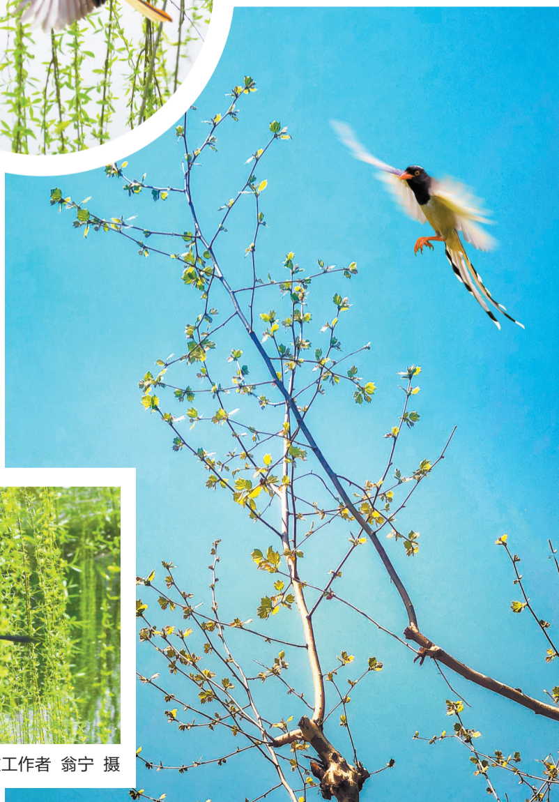
▲飞鸟弄枝。