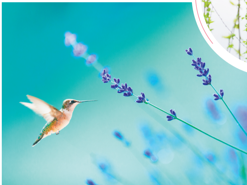
▲春鸟戏花。