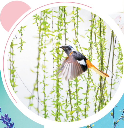
▲鸟语花香。 ▲柳岸闻莺。

春鸟来了,春天就无法抗拒地来了。春天的到来,浸湿了一个个村庄,牛、羊从干渴中生出许多幻想,幻想着一个春暖花开的日子。在春雨滋润下,一地蔓延的青草、一地鲜艳的小花、一地疯长的秧苗正努力伸展枝芽去与一只只叫得清脆的春鸟交流心中对春天的感受。