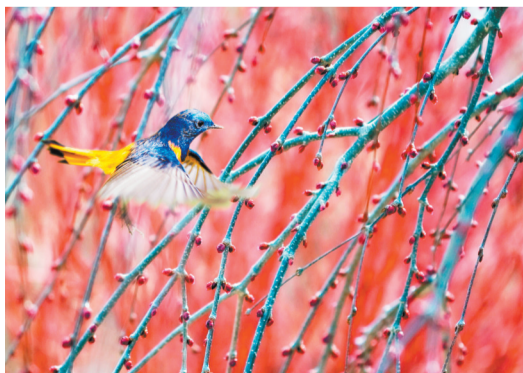
▲雀舞春枝。