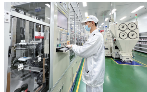
厦门海辰锂电智能制造生产线

随着铜梁的产业转型升级之路越走越深,目前全区科技型企业超过800家,国家高新技术企业达到130家,全区市级以上新型研发平台达到58个。