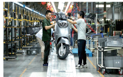
铜梁产爱玛电动车