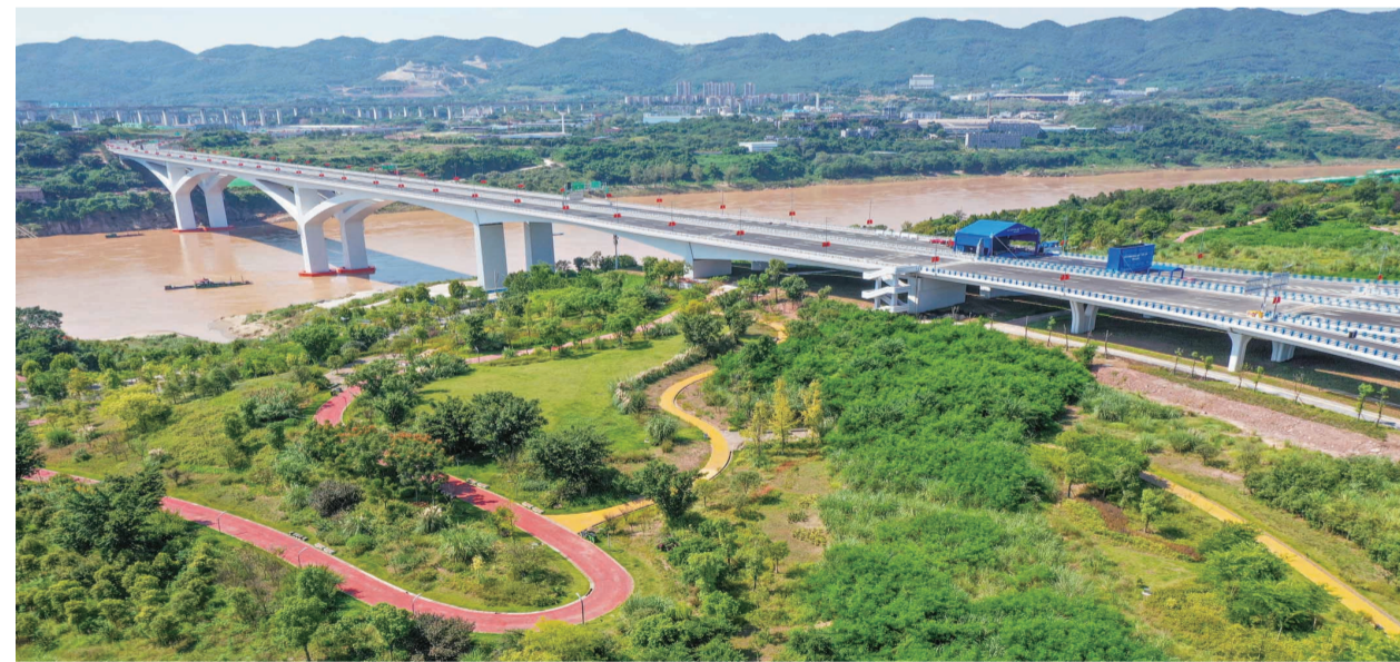
两江新区金海湾公园边坡绿化美化

随着这项工作大力推进，我市独具特色的山地立体城市风貌特色凸显，绿色生态本底日趋坚实。特别是中心城区城市绿量大幅增加，城市“秃斑”逐步消除。一张张坡坎崖“挂毯”不仅扮靓了城市，也提升了市民生活