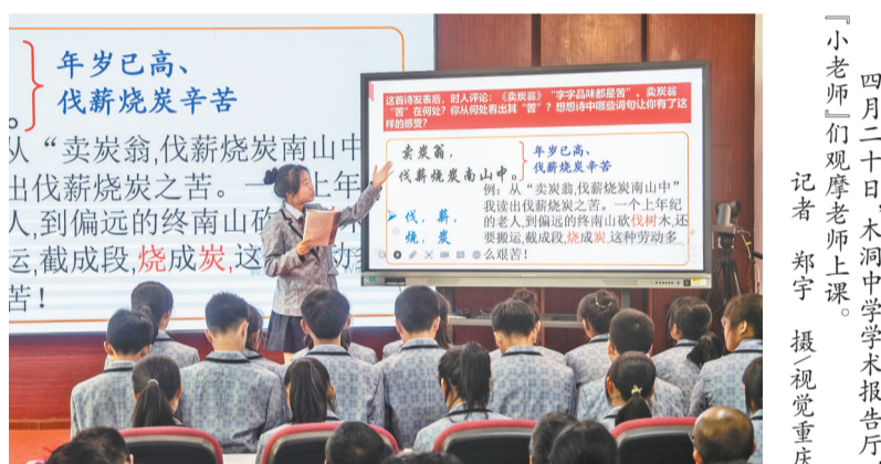
四月二十日,木洞中学学术报告厅,“小老师们”观摩老师上课。