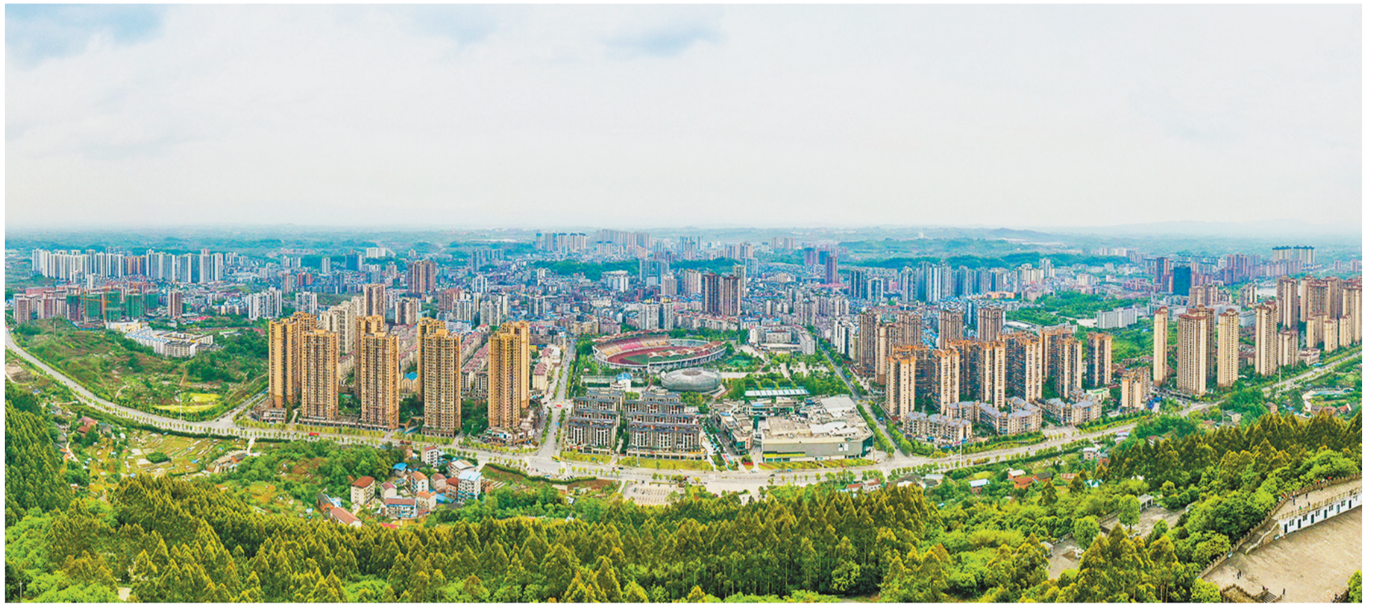
四月十八日，青山环抱下的垫江县城。

近年来，垫江县深入学习贯彻习近平总书记对重庆所作重要讲话和系列重要指示批示精神，紧扣“三区两地一节点”功能定位，构建城市化功能区、农产品主产区、农文旅融合功能区“三个功能区”，并以高新区建设工程、东部新区建设工程、明月山乡村振兴示范带建设工程、交通物流枢纽建设工程“四大工程”为重要抓手，奋力实现发展质量大跃升、城市能级大跃升、治理效能大跃升、生活品质大跃升、党建水平大跃升“五大跃升”目标，生态美、经济强、百姓富现代化新垫江美好蓝图正徐徐铺展。