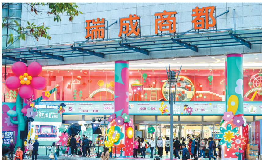
新世纪百货瑞成商都开启“乐享生活17 say hi”十七周年庆活动