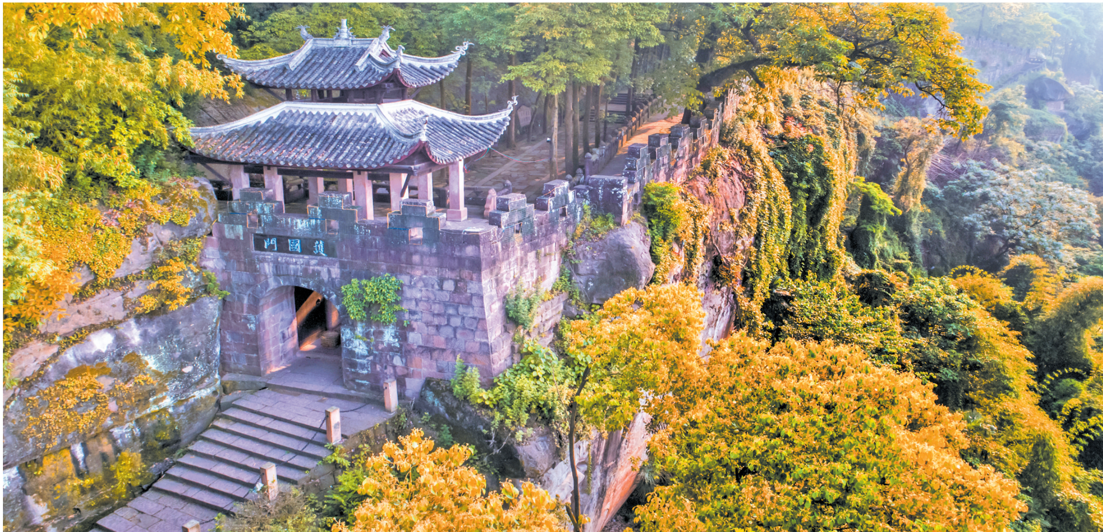
钓鱼城古战场遗址