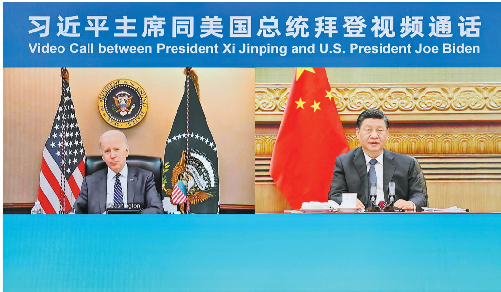
3月18日晚,国家主席习近平在北京应约同美国总统拜登视频通话。

新华社北京3月18日电 国家主席习近平18日晚应约同美国总统拜登视频通话。两国元首就中美关系和乌克兰局势等共同关心的问题坦诚深入交换了意见。拜登表示,50年前,美中两国作出重要抉择,发表了“上海公报”。50年后的今天,中美关系再次处于关键时刻,中美关系如何发展将塑造21世纪的世界格局。我愿重申:美国不寻求同中国打“新冷战”,不寻求改变中国体制,不寻求通过强化同盟关系反对中国,不支持“台独”,无意同中国发生冲突。美方愿同中方坦诚对话,加强合作,坚持一个中国政策,有效管控好竞争和分歧,推动中美关系稳定发展。我愿同习近平主席保持密切沟通,为中美关系把舵定向。 习近平指出,去年11月我们首次“云会晤”以来,国际形势发生了新的重大变化。和平与发展的时代主题面临严峻挑战,世界既不太平也不安宁。作为联合国安理会常任理事国和世界前两大经济体,我们不仅要引领中美关系沿着正确轨道向前发展,而且要承担应尽的国际责任,为世界的和平与安宁作出努力。