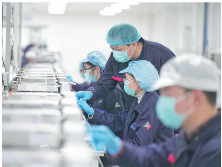
中元汇吉仪器生产车间