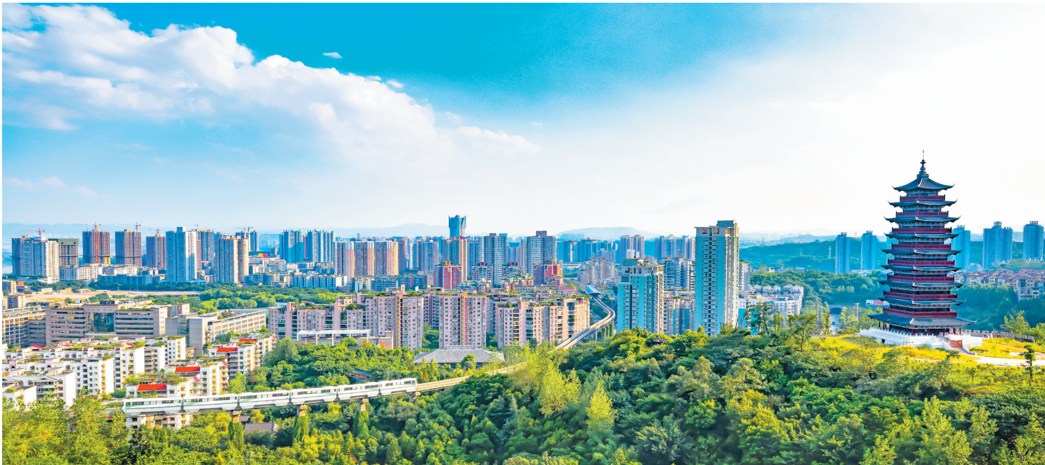
大渡口全景