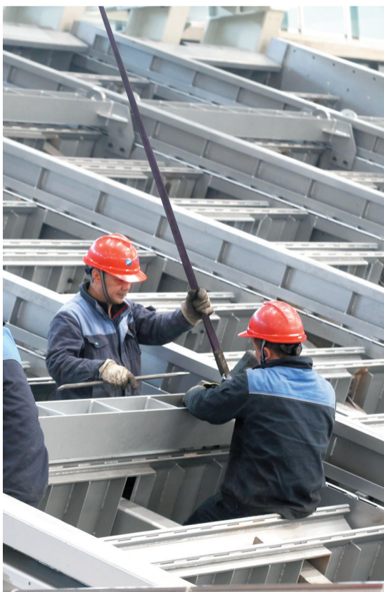
三峰卡万塔公司的工人正在检测生产的焚烧炉装备

至此，大渡口区宣布：大渡口老工业基地改造试点任务基本完成。未来，大渡口区将重点聚焦打造大数据智能化、大健康生物医药、生态环保、新材料、重庆小面五大百亿级产业集群，推动国家产业转型升级示范区建设取得重大进展，新兴产业发展水平进入全市先进行列。