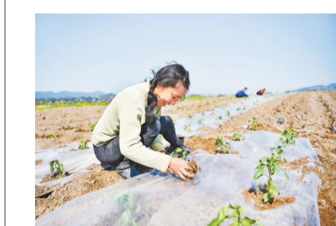
日前,巴南区莲花街道大中村,村民将菜苗从膜里取出。随着气温回升,大中村蔬菜基地到处是春耕播种的繁忙景象。