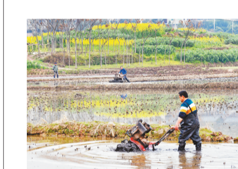
近日,荣昌区安富街道洗布潭村,田间地头一派忙碌景象。农户们正在犁田、播种,抢抓农时进行春耕生产。