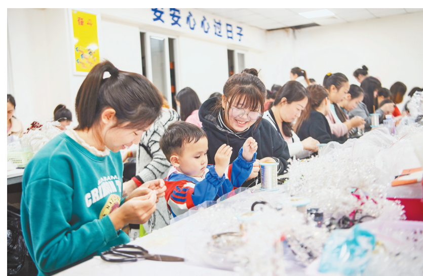
3月9日,九龙坡区华岩镇民安华福社区“双更”就业基地的“巧手梦工场”内,女工们正熟练地工作。

据了解,民安华福社区在“家门口就业”的基础上,统筹整合就业、创业、培训等公共就业服务资源,创建我市首个“更加充分更高质量就业基地”。