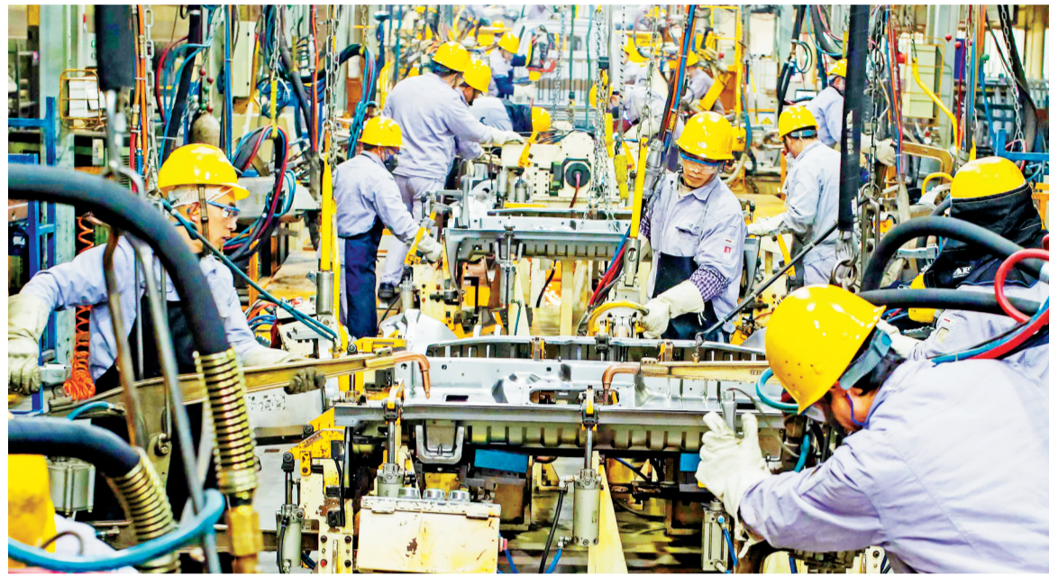
上紧张作业。(摄于二〇二一年一月四日) 特约摄影 孙凯/视觉重庆

张兴海注意到这样一组统计数据：近5年来，国内平均每年有150万名劳动力离开制造业，特别是在受疫情影响程度最大的2020年，某平台曾公开表