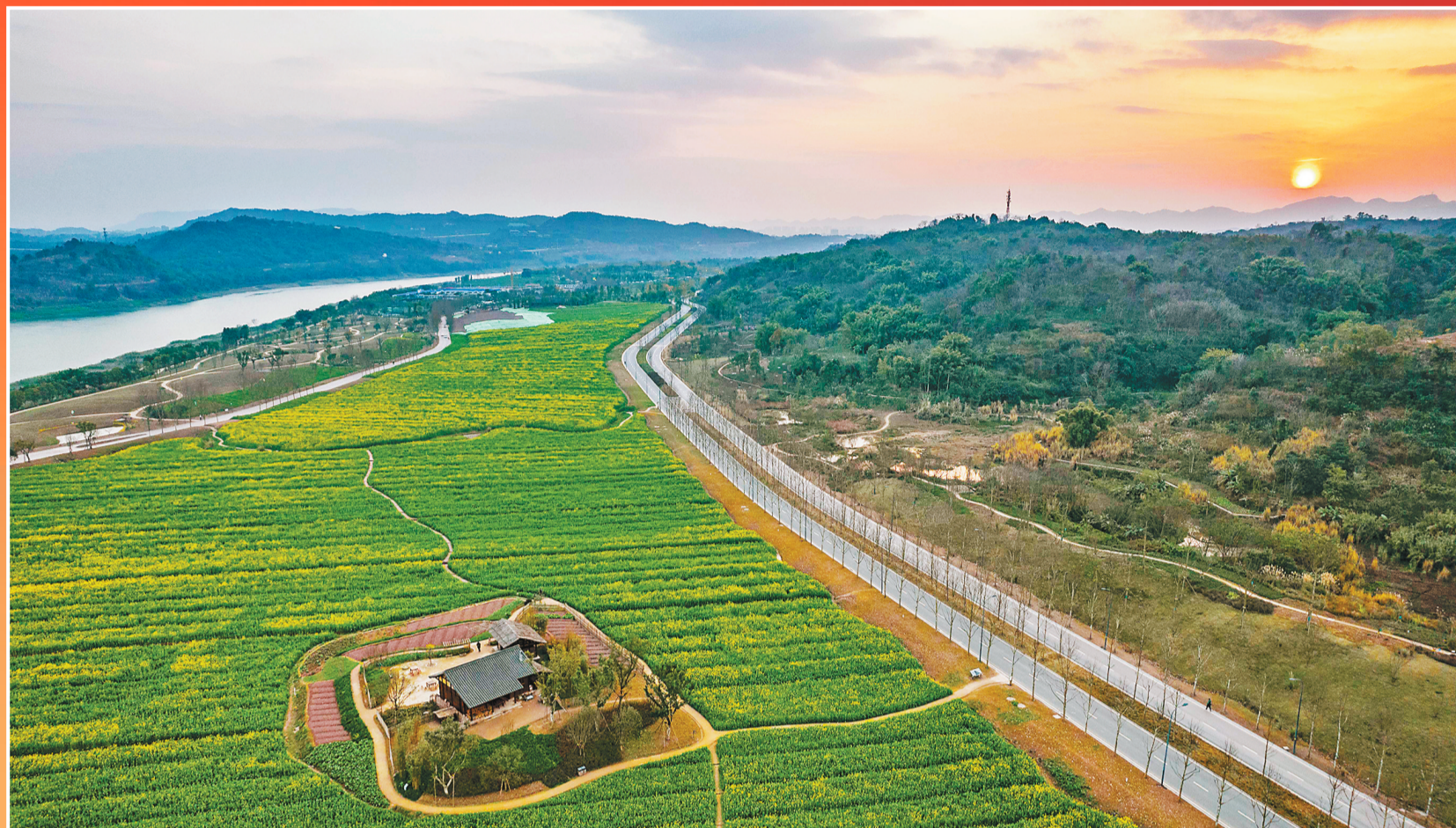
广阳岛,夕阳下的油菜花田。广阳岛已成为重庆的一张“绿色”名片。(资料图片)