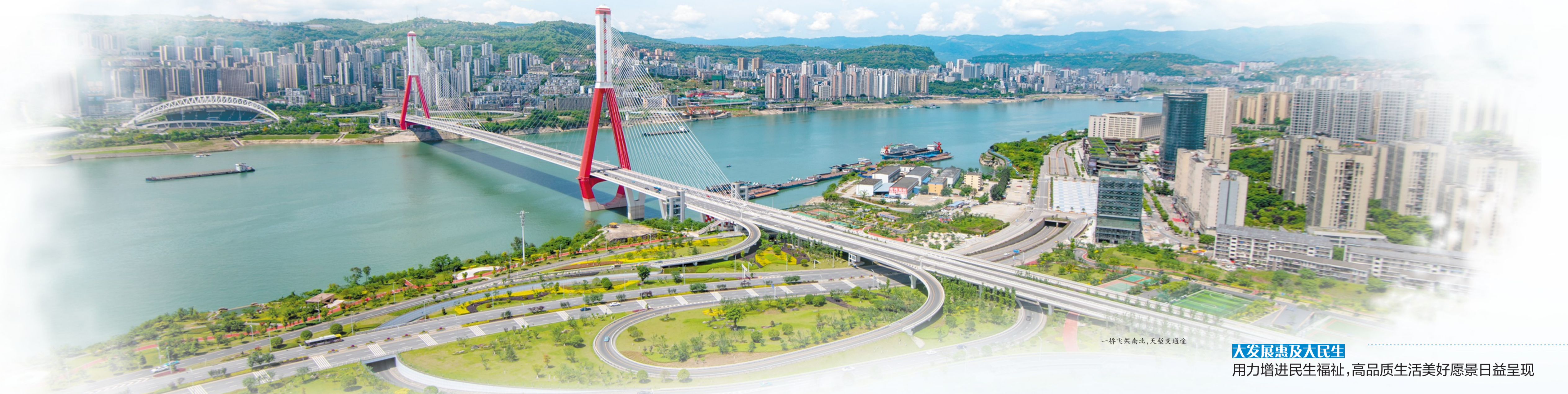
一桥飞架南北，天堑变通途

几年来，万州坚定贯彻新发展理念，牢牢把握新发展阶段，积极融入新发展格局，抢抓成渝地区双城经济圈建设、全市“一区两群”协调发展等战略机遇，深入实践“一心六型”两化路径，充分发挥处于“一带一路”和长江经济带联结节点、“承东启西、联南接北”的区位优势，聚力“一区一枢纽两中心”，建设大交通，发展大物流，推动大发展，惠及大民生，在推动高质量发展、创造高品质生活的征程上交出了一份精彩的答卷。