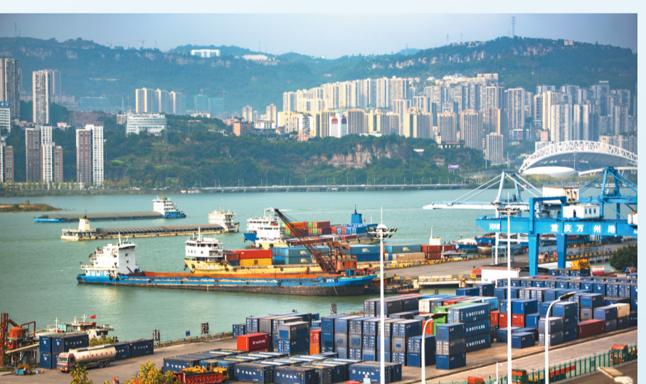
铁水联运，万州港一片繁忙

3月2日上午，乘着温暖的春风，装载着重庆湘渝盐化有限责任公司23个标箱氯化铵产品的民生轮船公司“民履轮”在万州港解缆启航。一天后，这批货物将抵达重庆果园港，并通过西部陆海新通道经广西钦州港出海运往马来西亚的民都鲁港。 这是万州探索江铁海联运方式，积极融入西部陆海新通道的首次尝试。而渝东北等地出口东南亚的产品，通过江铁海联运全程运输时间将比传统江海运输缩短7至10天。 江铁海、铁水、公水、水水中转等，无论是哪种联运模式核心就是“联”，使之实现货物换装无缝衔接，达到快捷高效低成本目的。 万州集散转换多式联运工程作为首批市级多式联运示范工程项目，每年可通过万州港中转金属矿石、粮食、煤炭等大宗货物3000万吨，且每年以5%的速度增长，打造了川渝东向物流快速出海通道。 数据显示，去年全区货运总量呈强劲增长态势，首破“亿吨”大关；船舶运力排名全市第二，物流业总产值突破百亿元。 万州港作为渝东和三峡库区最大的港口，一直以来是渝东、川东北、湘鄂、陕南、黔北等西南地区重要的物资出海通道，是长江十大港口之一，被国家列为长江干线重点建设的五大用途港口之一。 和煦春风拂面，站在万州港向远望去，各个港口坐落长江沿线，船只来往，进出货，蔚为壮观。南岸，是全市四大枢纽港之一的新田港和除果园港外最大的集装箱作业区江津港口集装箱码头；北岸，是桐子园码头和目前三峡库区铁水联运条件最好的港区红溪沟码头。 在红溪沟铁水联运港区，数台龙门吊连轴装卸，刚刚搭乘火车从陕西、新疆而来的煤炭，便立即装上货车，发往奉节、石柱、涪陵等地。而一列货车正在装货，准备将从下游来的进口铁矿石发往四川达州。 万州围绕铁路、水运、航空、公路综合立体交通体系基础，分为东、西、南、北四向发力，有序推动物流通道建设，真正做到物畅其流，让企业到世界市场去竞争。 一路向东，直连大海。沪渝直达快线万州班列去年6月成功首航，与传统的运输方式相比，货物运输时间减少1至2天，长江段物流成本降低10%至15%，极大增强了万州港的集货能力和对四川、陕西、甘肃、湖北等省的周边地区辐射能力。 一路向西，直通欧洲。稳定运行“普万”“达万”物流通道，货运量保持平稳增长；粮食散改集“水水中转”集装箱班列，加快构建对内循环供应链体系；同时，积极开展中欧班列开行前期工作，努力打造中欧班列渝东北集结点。 一路向北，直到东北。强化与兰州、西安等城市联系，组织西北货源，拓展物流通道，去年“西万”通道货运量同比增长42.9%，“西万”通道增长态势进一步巩固。 一路向南，直抵东南亚。除开行万州港—果阿港—钦州港江铁海联运班列外，还积极谋划万州—防城港公路冷链物流专线，争取2022年开行，促进东南亚地区优质水果、生鲜食品同万州特色农产品双向流通。 …… 从东到西，从北到南，从农村到城市，从内陆到沿海，万州正依托长江黄金水道、高速铁路、高速公路、航空口岸等通道优势，构建起联通全国的开放发展物流大网络。