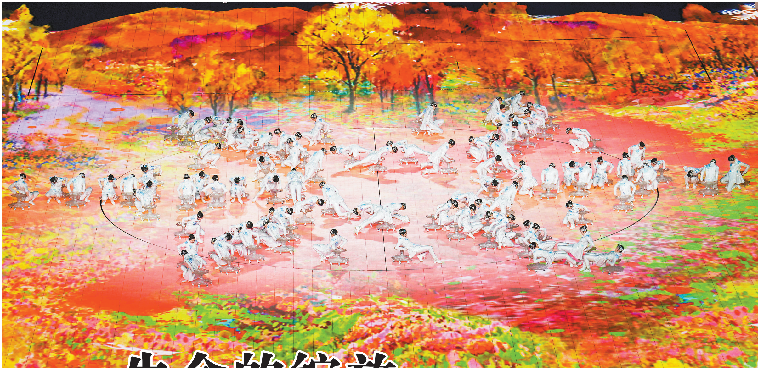
三月四日晚，北京二〇二二年冬残奥会开幕式在北京国家体育场举行。这是开幕式现场。