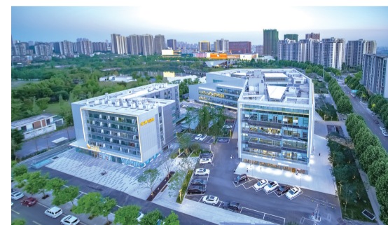
龙湖冠寓重庆礼嘉天街店