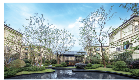
龙湖重庆千山新屿·天屿交付实景图