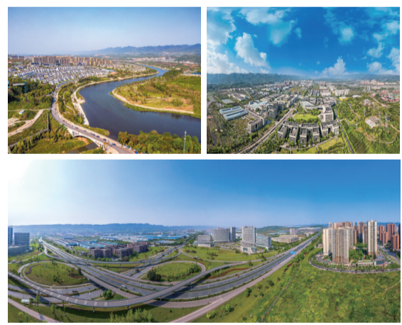
建设产城景融合发展的现代化新城