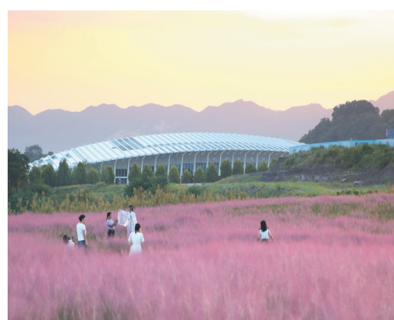
努力打造国际化、绿色化、智能化、人文化现代城市样板