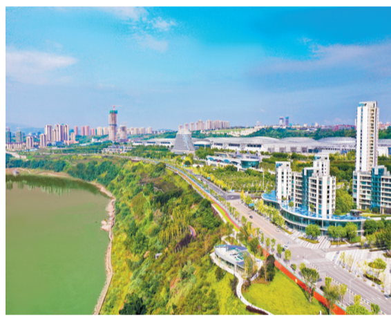
打造国际化、绿色化、智能化、人文化的美丽智慧江湾