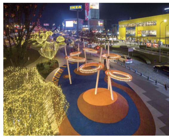
建设成为国际消费中心城市的核心承载地、城市形态展示新高地和对外开放新窗口