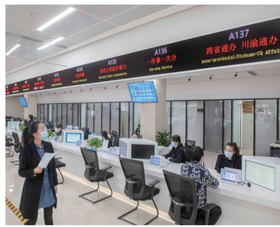
努力在成渝地区双城经济圈建设和“一区两群”协调发展发挥示范引领作用