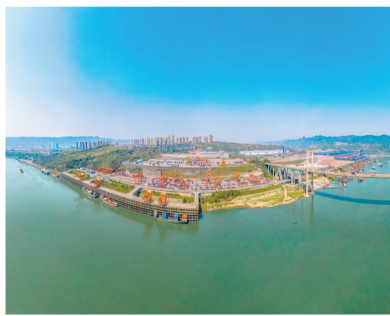
建成内陆型开放口岸、国际物流枢纽和大宗商品交易中心的“三合一”现代化枢纽港