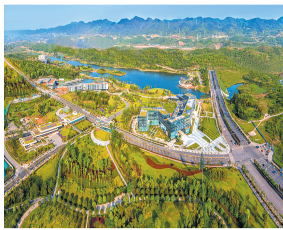
发挥产业协同、人才协同、生活协同、生态协同，助力打造具有全国影响力的科技创新中心

这十大工程预计“十四五”期间每年投资超千亿元。十大工程全面铺开半年多时间，已形成不少新的实物工作量、可视化成果。其不仅促使两江新区加快产业转型升级，做大做优增量，培育出新的增长点，使两江新区成为全市高质量发展的重要阵地，还助推了全市加快建设具有全国影响力的科技创新中心、内陆开放高地、国际消费中心城市，更助力了成渝地区双城经济圈国家重大战略部署落地。