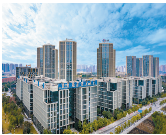
大力发展“AI+”“大数据+”“5G+”等新型业态，构建更具吸引力的数字经济产业创新生态