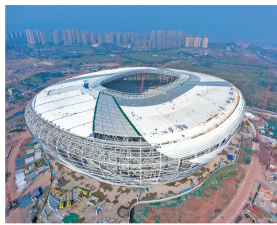
打造具有国际影响力体育赛事及产业集聚区