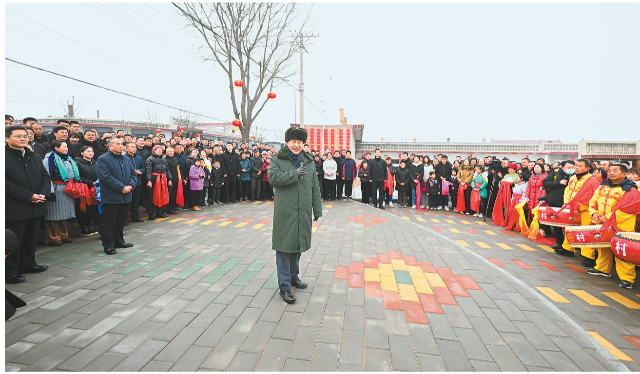
1月26日至27日,中共中央总书记、国家主席、中央军委主席习近平来到山西,看望慰问基层干部群众。这是26日下午,习近平在临汾市汾西县僧念镇段村文化广场,给乡亲们拜年,向全国各族人民、向港澳台同胞和海外侨胞致以美好的新春祝福。