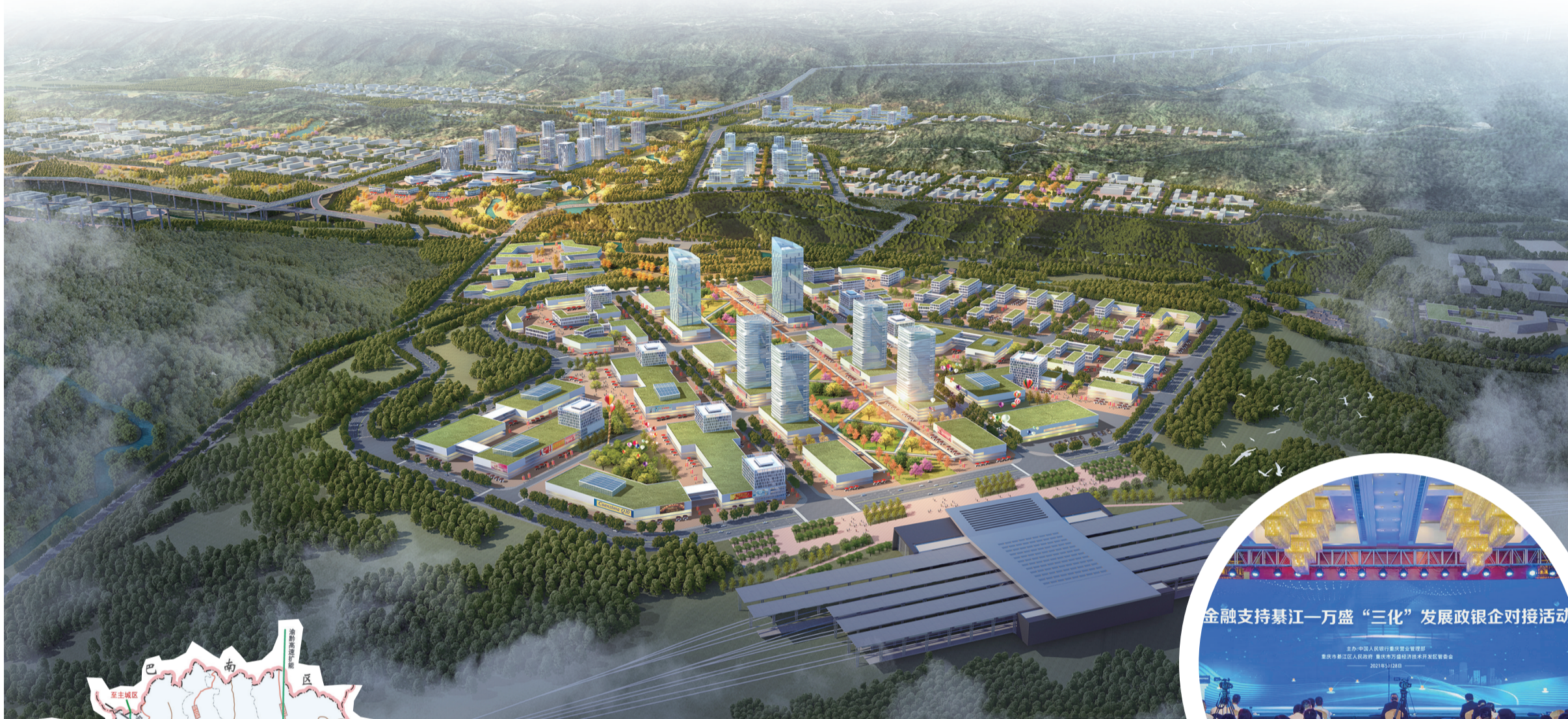
綦江—万盛创新经济走廊城鸟瞰效果图

在全局中谋划一域，以一域服务全局。融入成渝地区双城经济圈建设，打造西部陆海新通道渝黔综合服务区，建设渝黔合作先行示范区，打造主城都市区重要战略支点、共建重庆“南大门”。如今一年时间过去，綦江—万盛创新经济走廊建设近况如何？綦江在綦江—万盛创新经济走廊有何作为，还有哪些新动向、新打算？