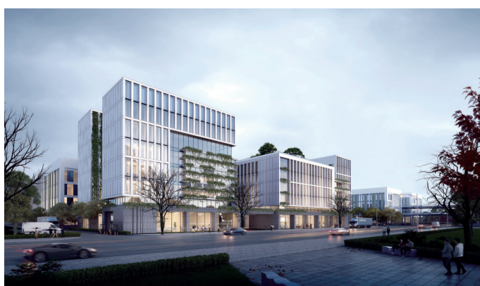
侨企产业园标准化厂房效果图