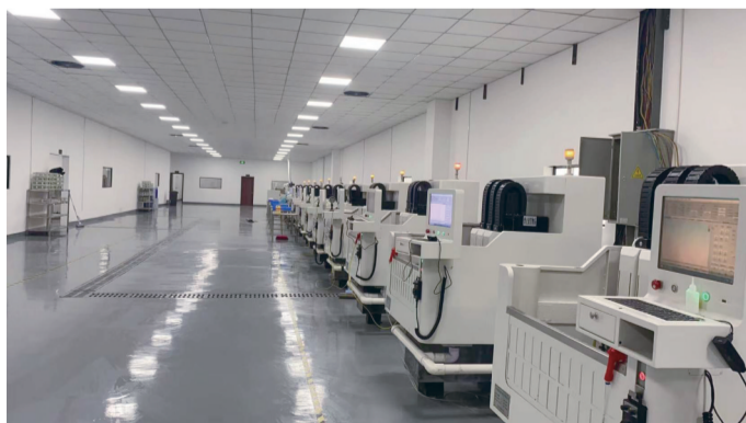
引进高新技术智能终端设备盖板及5G终端机壳项目生产车间